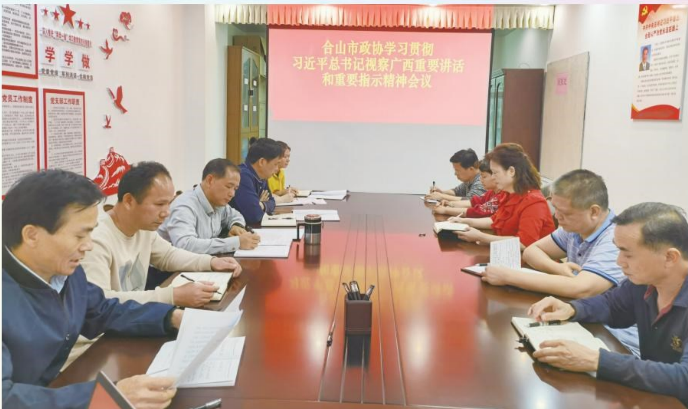
专题学习习近平总书记重要讲话和重要指示精神

2021年4月30日,合山市政协系统组织开展学习贯彻习近平总书记赴广西考察的重要讲话和重要指示精神专题学习研讨会。