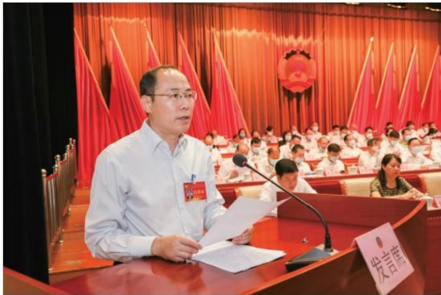
市政协主席韦文晋在大会上作讲话。

2020年是决胜全面建成小康社会、决战脱贫攻坚之年，也是“十三五”规划收官之年。一年来，在中共来宾市委的正确领导下，市政协及其常务委员会以习近平新时代中国特色社会主义思想为指导，学习贯彻中共中央、自治区党委和市委政协工作会议精神，全面加强党对政协工作的领导。坚持发扬民主和增进团结相互贯通、建言资政和凝聚共识双向发力，发挥专门协商机构作用，广泛团结参加人民政协的各党派团体和各族各界人士，围绕中心、服务大局，