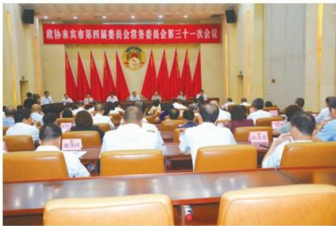
6月17日,政协来宾市第四届委员会常务委员会召开第三十一次会议,听取汇报并审议相关事项。

审议通过市政协2021年协商计划(草案);审议通过政协来宾市第四届委员会第六次会议政治决议(草案)。