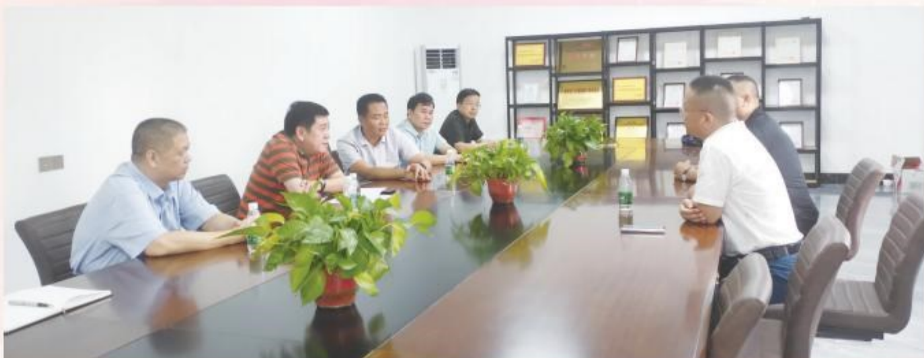
6月21日,市政协副主席曾广斌到联系重大项目调研并召开座谈会。在广西华臻新材料有限公司听取并了解各项目整体推进进展和项目建设中遇到的困难和问题,协调解决重大项目推进面临的突出问题。