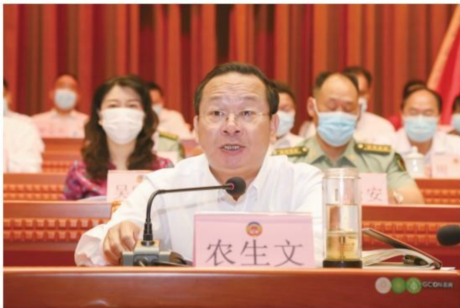
市委书记农生文在开幕大会上作重要讲话。(李冠才/摄)

在全市上下全面深入学习贯彻落实习近平总书记视察广西时的重要讲话精神，全力推动“十四五”开好局起好步，以优异成绩庆祝中国共产党成立100周年的关键时期，中国人民政治协商会议来宾市第四届委员会第六次会议，今天隆重开幕了。这是全市人民政治生活中的一件大事，也是广大政协委员参政议政、共商来宾发展大计的一次盛会。在此，我代表中共来宾市委，对大会的顺利召开，表示热烈的祝贺！向全体政协委员和与会同志，并通过你们