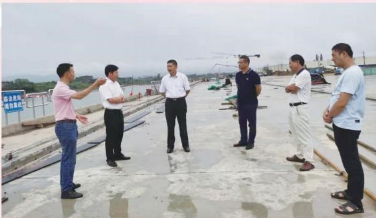
6月23日,市政协副主席刘德祥到武宣县开展联系推进重大项目调研活动,深入来宾港武宣港区龙从作业区一期工程项目现场调研,听取项目推进情况汇报,协调、督促加快推进项目建设进度。