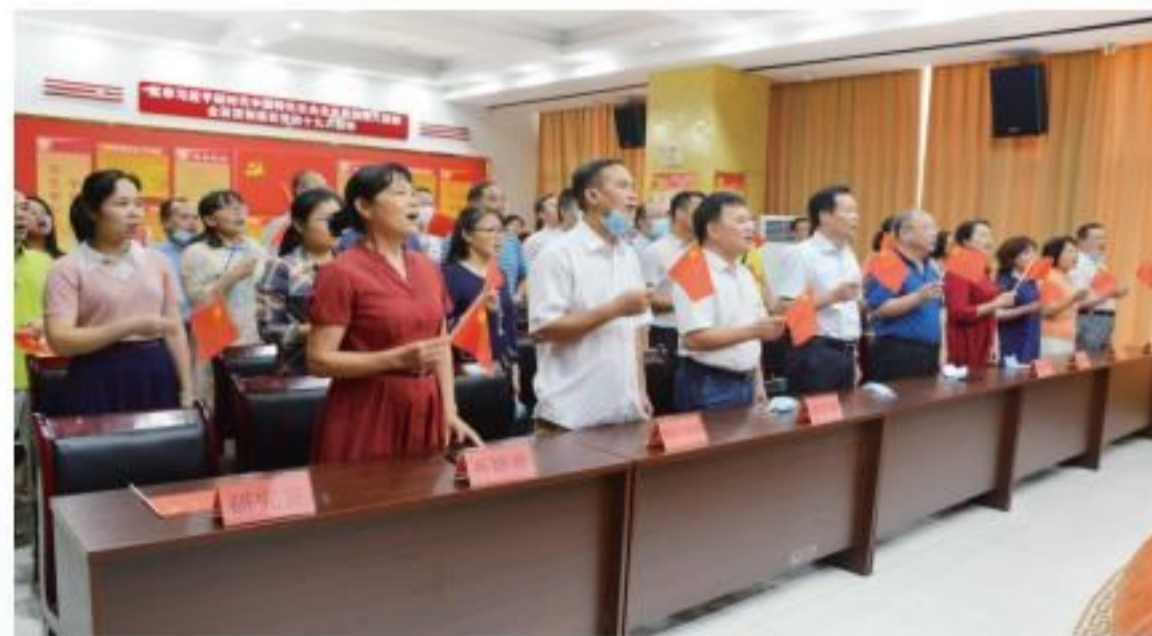
合唱经典革命歌曲《没有共产党就没有新中国》。