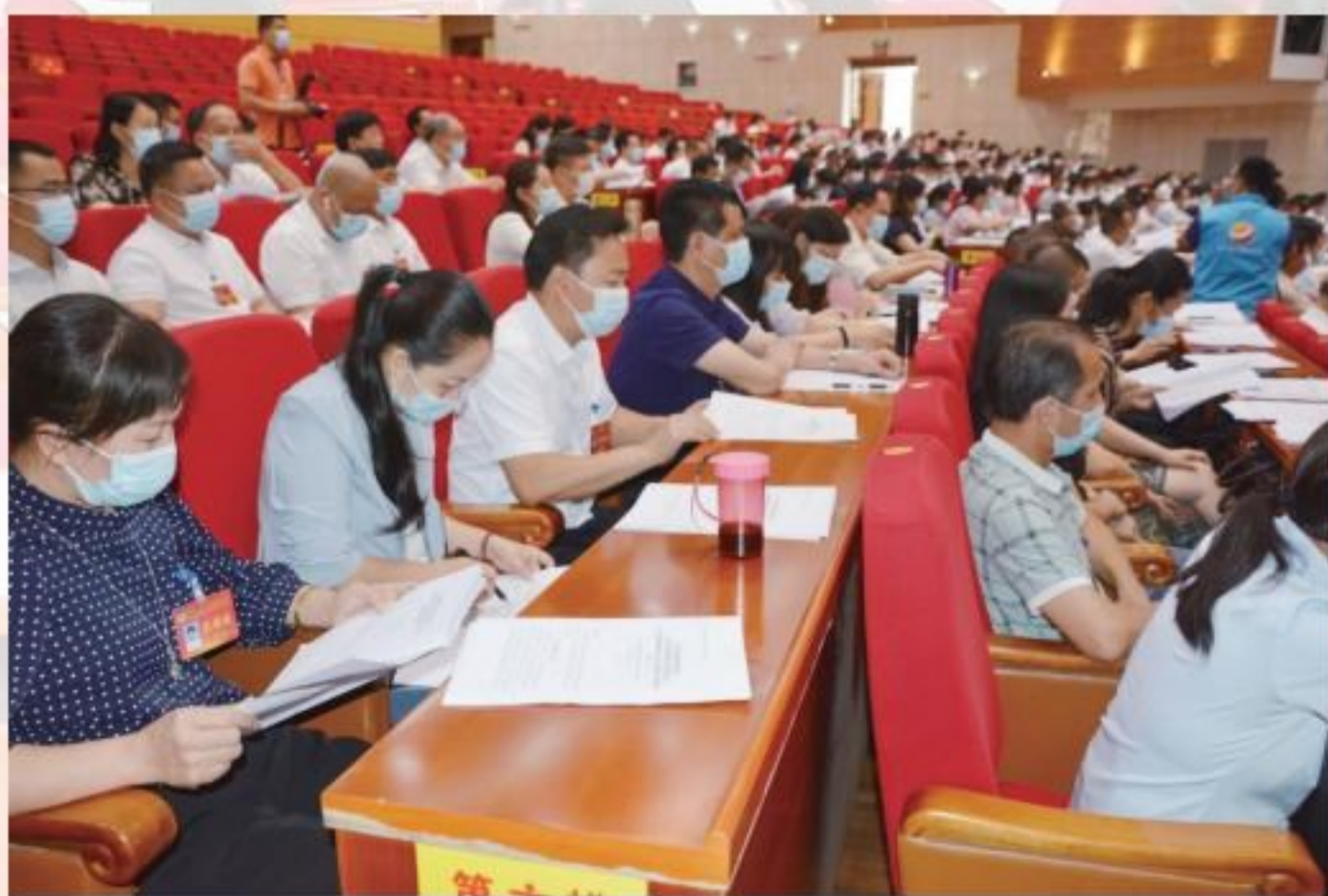
委员认真审阅报告