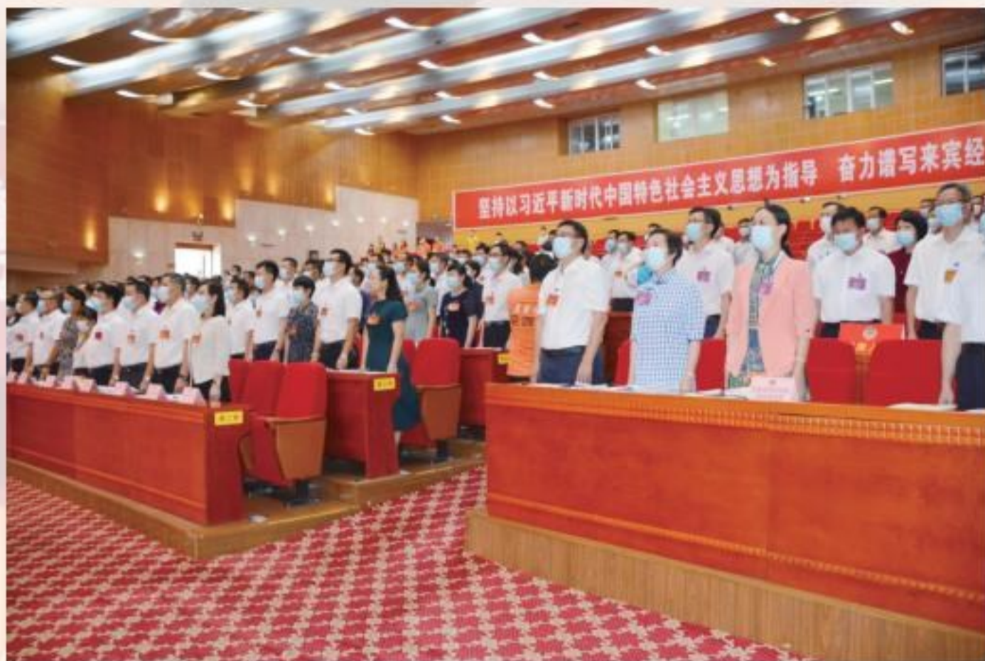
委员们起立,奏国歌