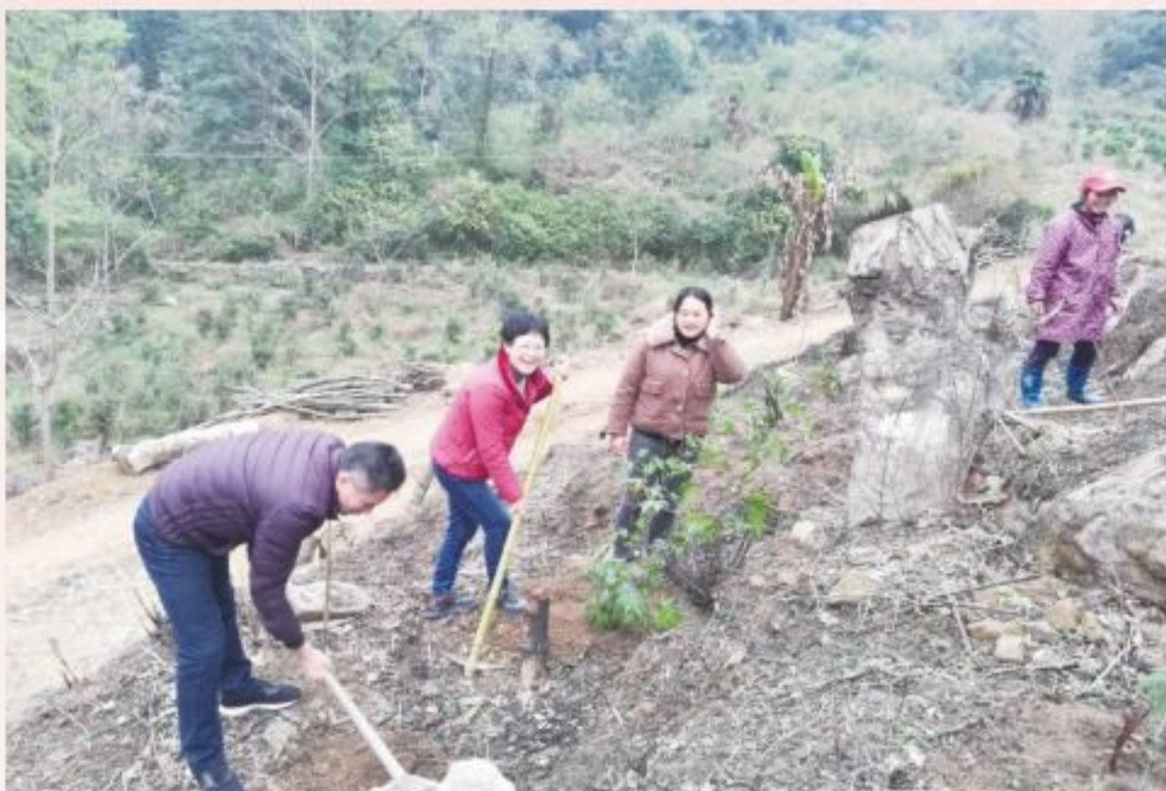
3月3日,市政协副主席黄锡萍(左二)深入扶贫联系点金秀县六巷乡大岭村开展服务“三农”春季大行动,积极推动巩固拓展脱贫攻坚成果同乡村振兴有效衔接。