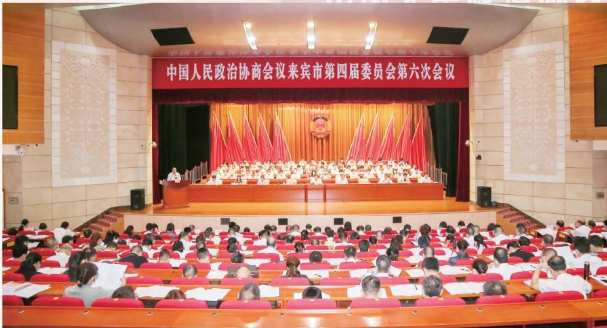
开幕大会现场