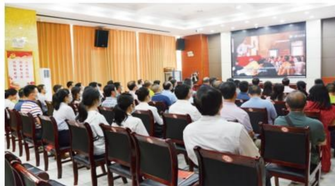
观看微电影《画说党史》。