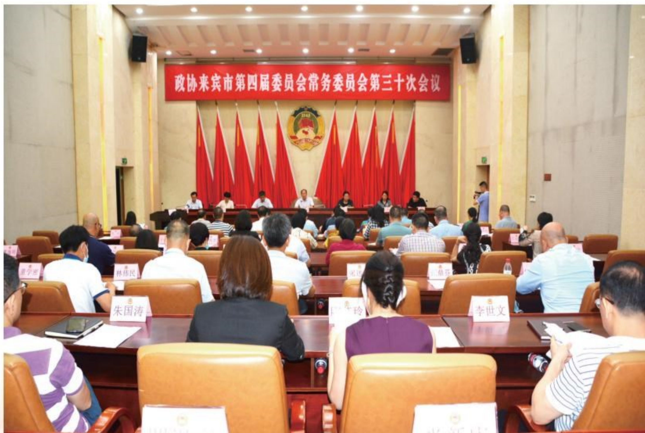
6月15日,政协来宾市第四届委员会常务委员会第三十次会议召开,审议通过有关人事事项。

治生活中的一件大事,要精心细致做好市政协四届六次会议各项工作,把工作落实到位,为大会召开营造良好的条件和环境。广大政协委员要以饱满的政治热情和昂扬的精神状态开好大会,要提高政治协商、民主监督、参政议政的水平,更好地凝聚共识,为我市完善“十四五”规划纲要,并实施好“十四五”规划贡献更多政协的智慧和力量,推动来宾经济社会高质量发展。