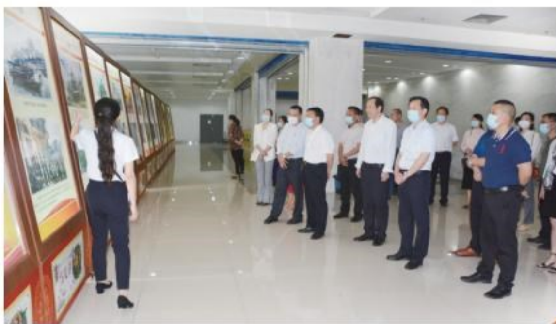
党史学习教育主题展览。