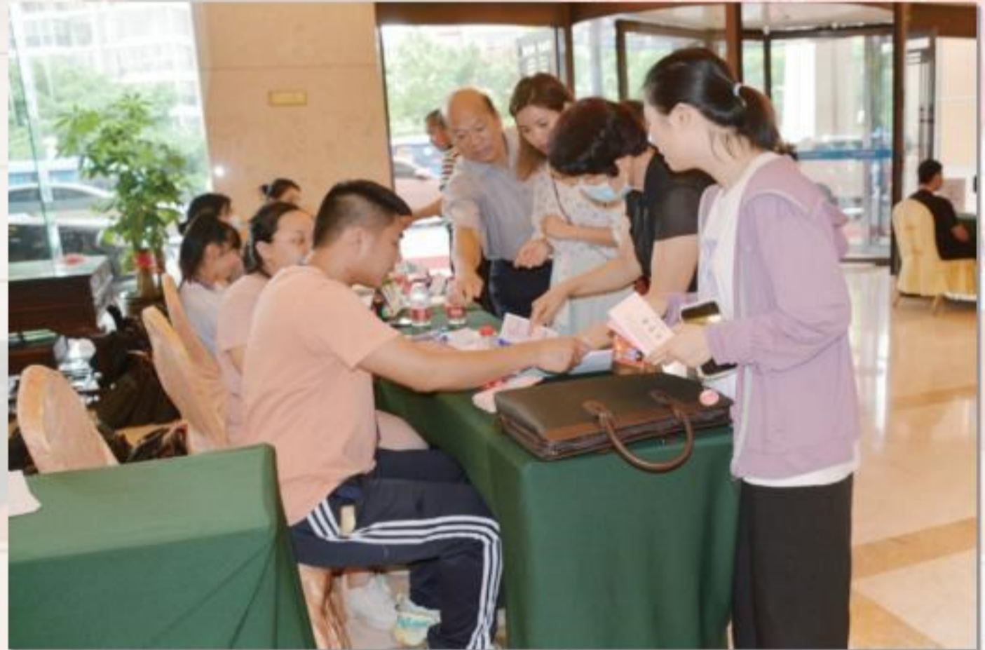
委员报到, 领取会议材料