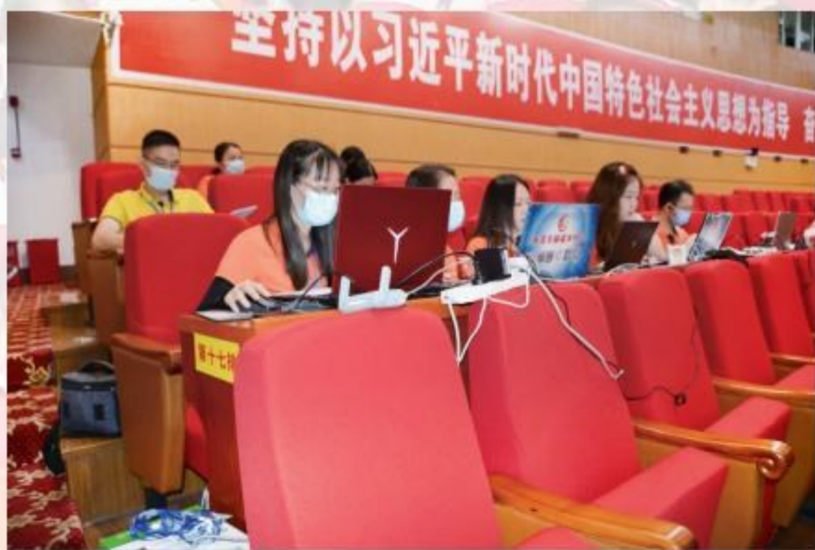
新闻媒体记者在会场作报道