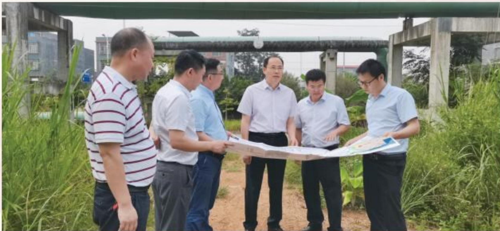
6月24日,市政协主席韦文晋(右三)到河南工业园区调研重大项目推进情况。