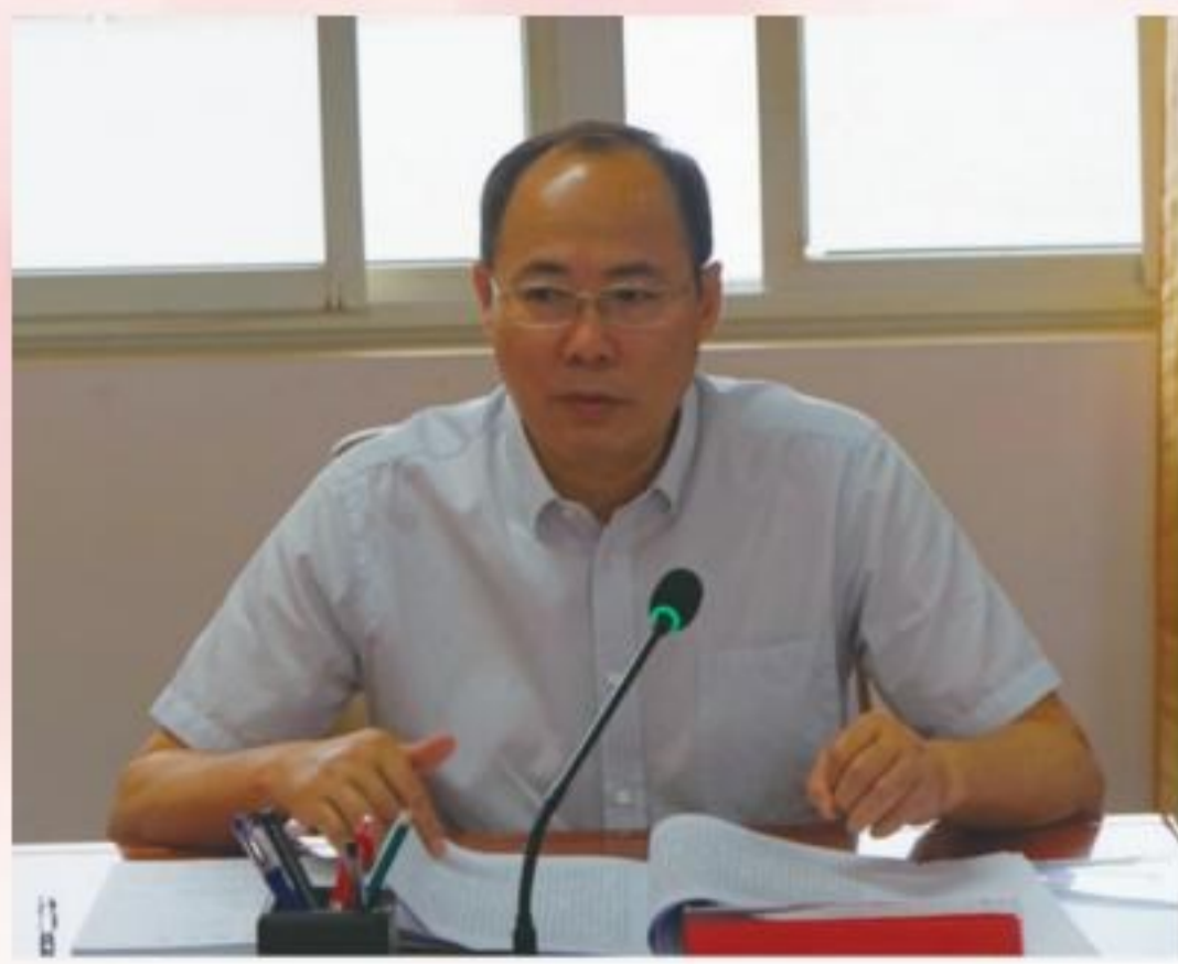
市政协主席、党组书记韦文晋主持会议。