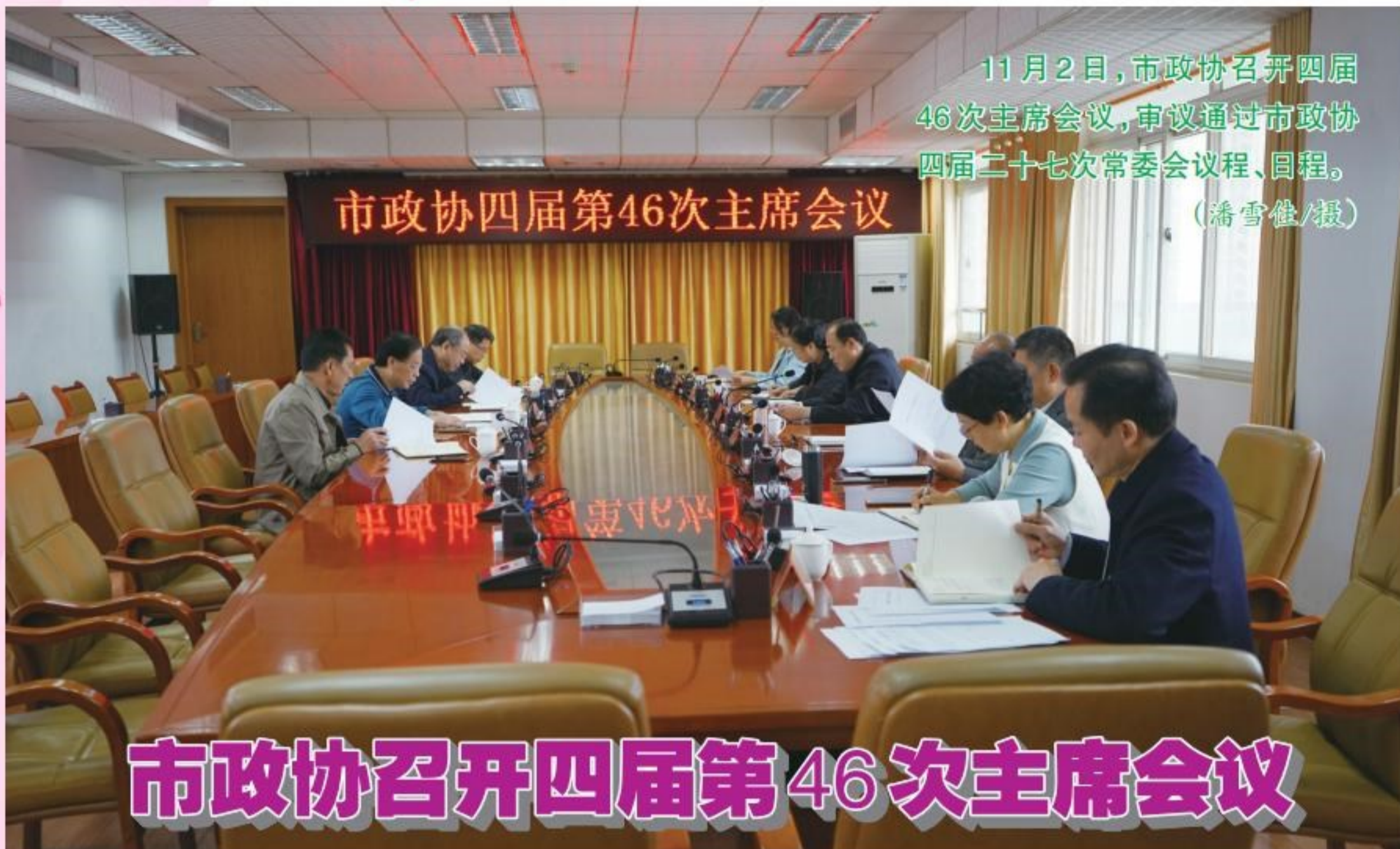
11月2日,市政协召开四届46次主席会议,审议通过市政协四届二十七次常委会议程、日程。