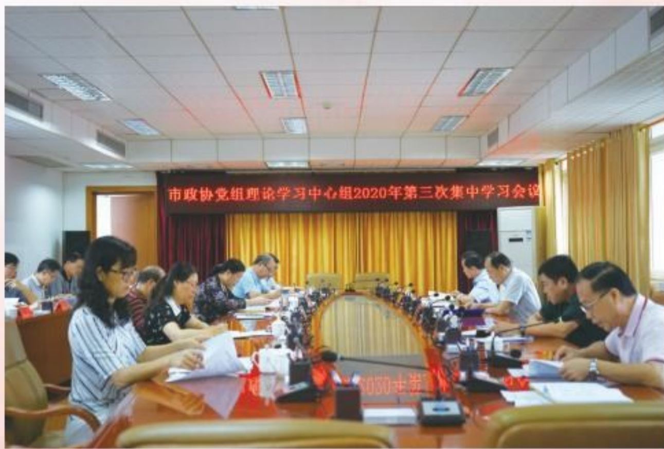
9月23日,市政协党组理论学习中心组召开2020年第三次集中学习会议。

谈治国理政》第三卷理论精髓,真正学懂弄通,做到学习跟进、认识跟进、行动跟进,以“跟进学”强化“跟着走”。要深刻学习领会习近平总书记关于百年未有之大变局以及党史、新中国史、改革开放史、社会主义发展史的重要论述,坚决把以习近平总书记为核心的党中央各项决策部署落到实处。要进一步落实好意识形态工作责任制,贯彻落实自治区政协专门委员会工作和制度建设意见,提高认识、抓住重点、持续努力,在扎实推进专委会工作上下好功夫、下足功夫。