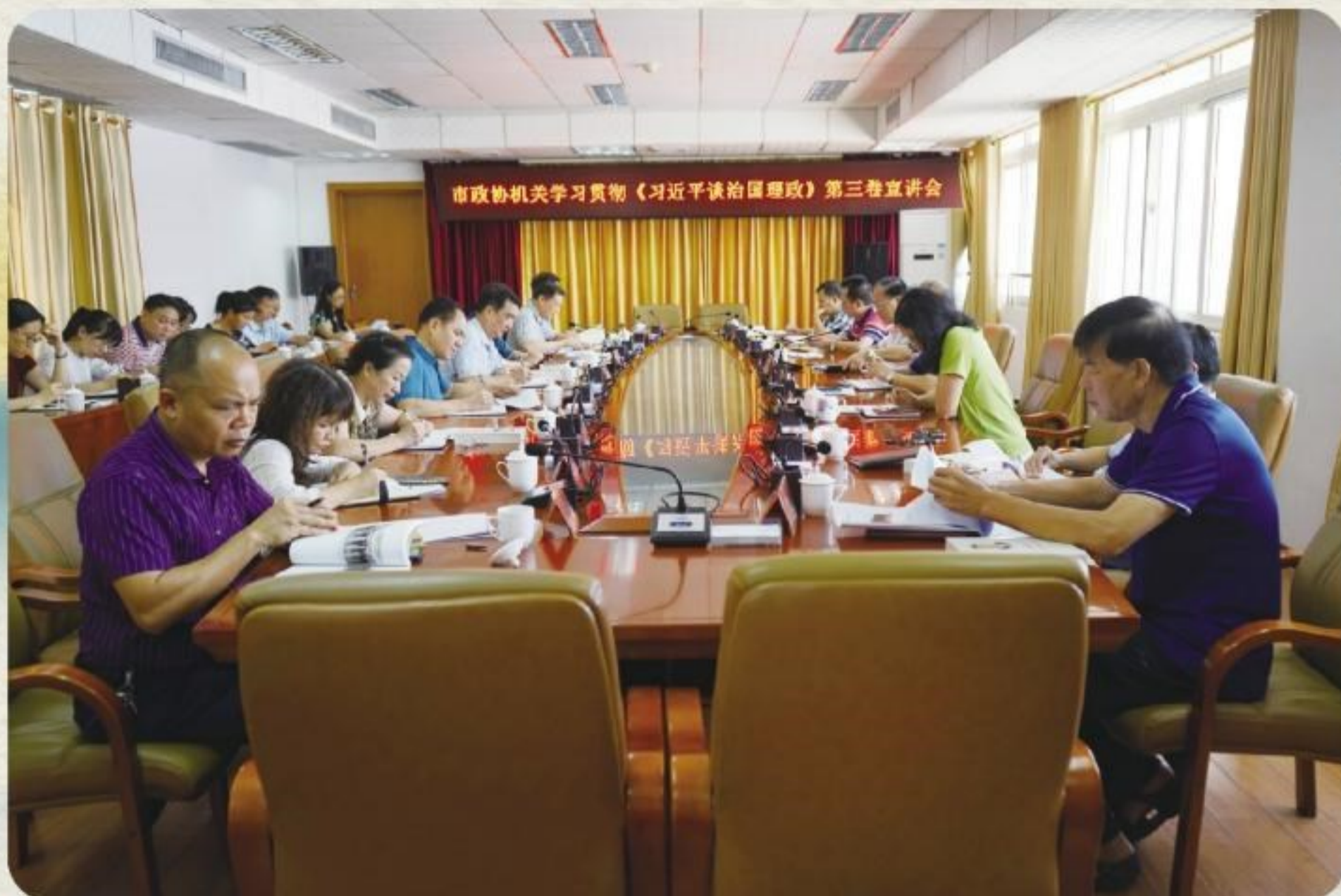
8月31日,市政协机关召开学习贯彻《习近平谈治国理政》第三卷宣讲会。