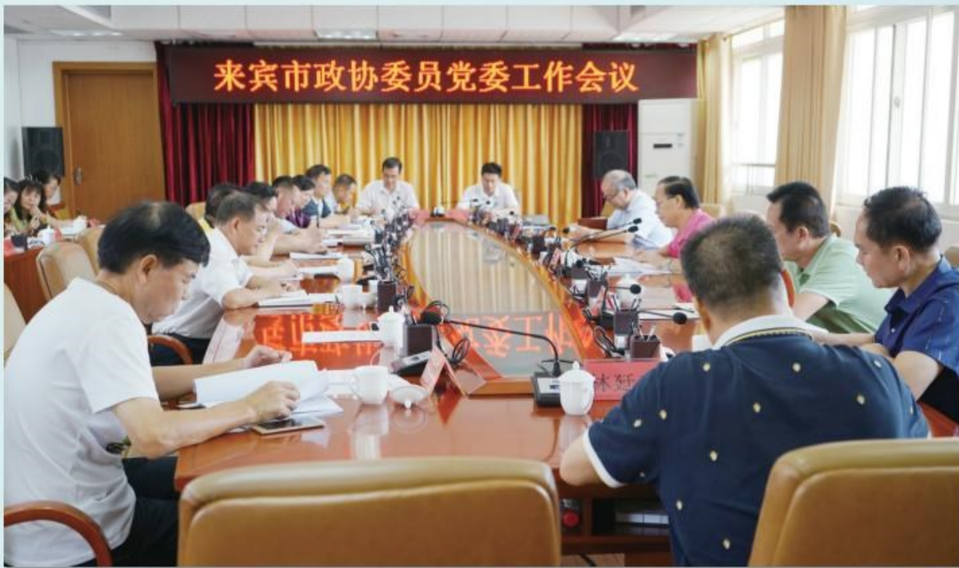
9月4日,市政协召开委员党委工作会议。

部网络学院平台进行党的十九届四中全会精神专题网络学习,并结合本单位本委室业务工作,围绕制约政协工作的关键问题开展研讨。