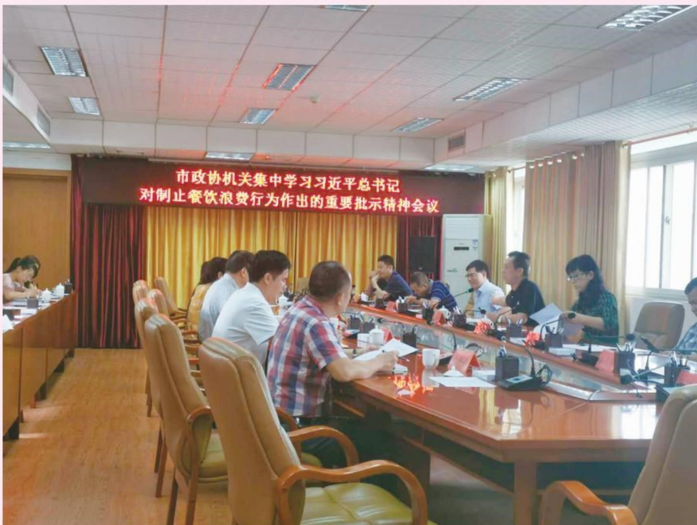
9月22日,市政协机关集中学习习近平总书记对制止餐饮浪费行为作出的重要批示精神会议。